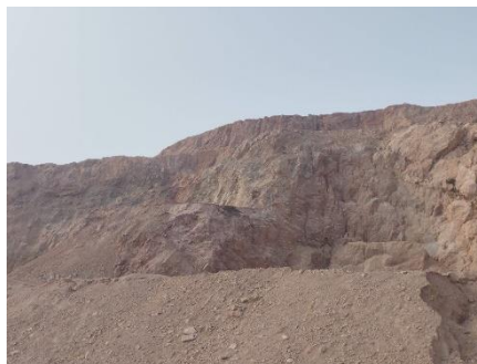
พื้นที่โครงการในปัจจุบัน