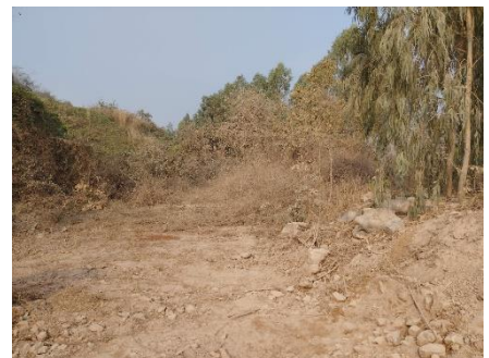
บริเวณพื้นที่เวนคืนการทำเหมือง